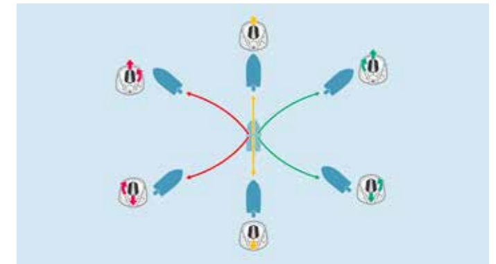
Yamaha Joystick Navigiere in engen Wasserstraßen und stark frequentierten Häfen mühelos und präzise mit dem Helm Master EX ® Joystick von Yamaha, der nun auch erstmalig für Einzelmotorisierung erhältlich ist.