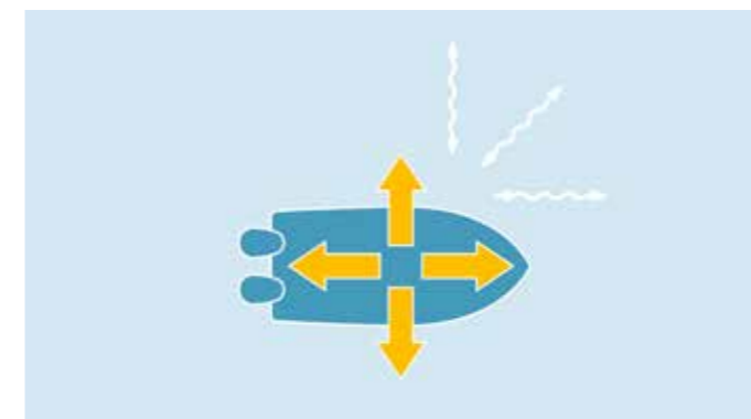
StayPoint Hält automatisch die exakte GPS-Position